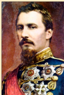
Alexandru Ioan Cuza