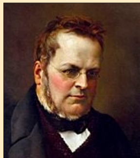
Primul-ministru al Regatului Sardiniei Emillio Cavour