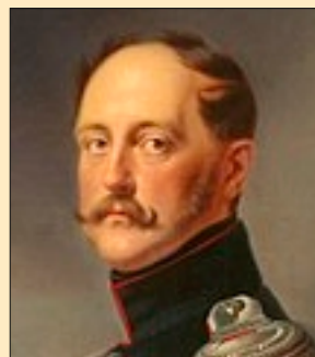
Țarul Rusiei Nicolae I