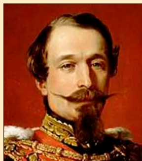
Împăratul Napoleon al III-lea